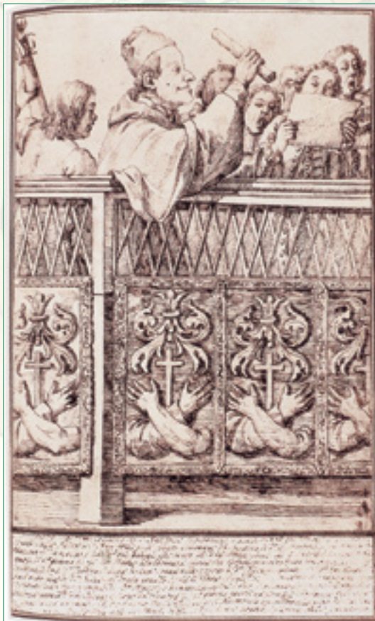
Pier Leone Ghezzi, Padre Giambattista Martini dirige una solenne liturgia nella basilica romana dei Santi Apostoli (1753).

Il progetto, giunto alla seconda edizione, risponde al desiderio di valorizzare musiche di grande interesse storico, stilistico ed esecutivo dovute a compositori emiliani per nascita o adozione, attivi nei secoli XVII e XVIII. L'attenzione quest'anno si focalizzerà su alcuni lavori per la camera e la liturgia (cantate e mottetti); in altre parole, musiche aliene dalla dimensione scenica e spettacolare, nelle quali il senso è veicolato dalla parola e dalle modalità con cui essa è espressa e offerta all'ascolto. Nei due appuntamenti, Romina Basso – interprete di fama internazionale e raffinata didatta – sarà coadiuvata da alcuni giovani interpreti e da alcune allieve di Canto rinascimentale e barocco del Conservatorio di musica “Francesco Venezze” di Rovigo; attraverso l'esecuzione di composizioni di D. Gabrielli, G. B. Martini, G. A. Perti e G. P. Colonna assieme mostreranno passo passo come il paziente lavoro di studio e interpretazione del testo illustri il senso della musica e disveli gli affetti.