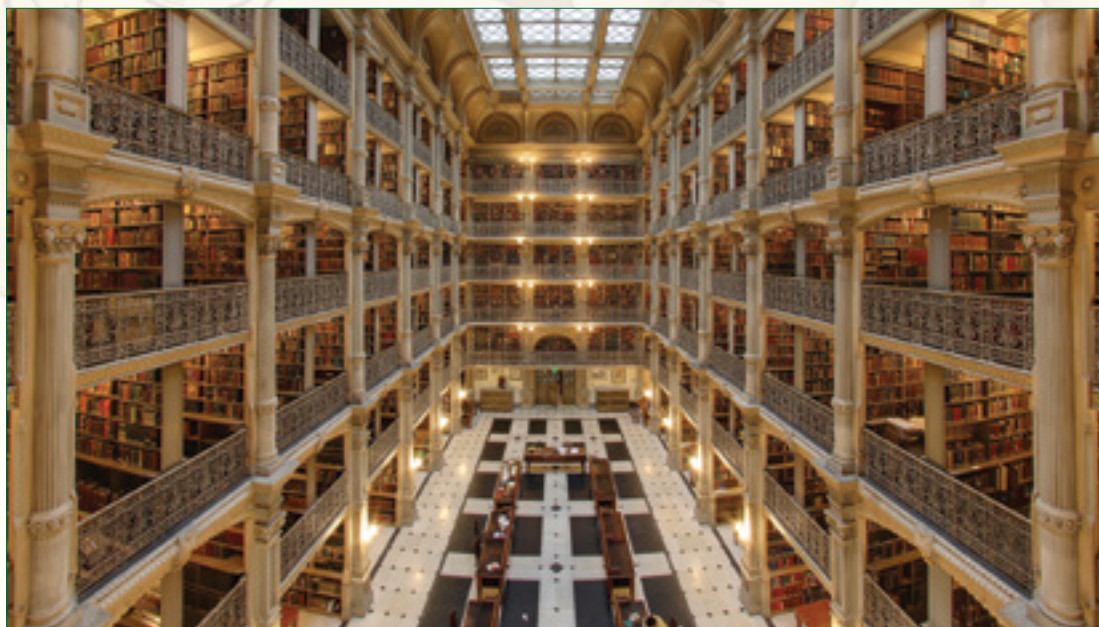
La George Peabody Library dell'università Johns Hopkins di Baltimora

Il programma particolareggiato del Colloquio sarà disponibile ai primi di novembre sul sito www.saggiatoremusicale.it