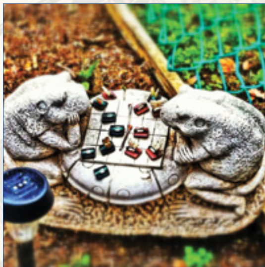
ph di A. Hall

La seconda parte sarà invece dedicata alla progettazione di gruppo, con sessioni di lavoro su concept , documentazione, paper prototyping o digital prototyping . Ogni gruppo sarà libero di scegliere temi e tipologia di prodotto da sviluppare, con la supervisione del docente. Non è richiesta alcuna specifica abilità informatica o di programmazione.