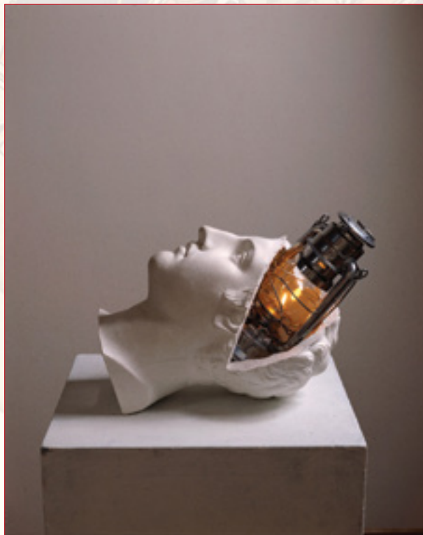
Claudio Parmiggiani, Senza Titolo , 1985.

Un ringraziamento al Forum Austriaco di Cultura (Milano) e allo Studio Claudio Parmiggiani