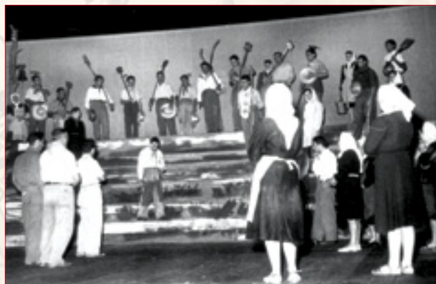
Sulla via della libertà, 1950