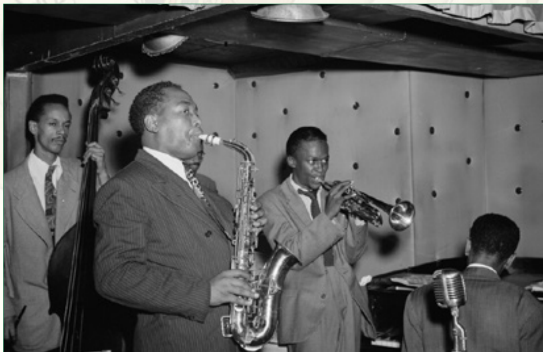
Alcuni componenti del quintetto di Charlie Parker a New York nel 1945 circa: da sinistra a destra Tommy Potter, Charlie Parker, Miles Davis e Duke Jordan.

La didattica della musica jazz ha conosciuto di recente nel nostro paese una rapida crescita, sia per quel che riguarda gli aspetti strumentali e improvvisativi, sia per quanto concerne l'ambito teorico e storico-critico. Tale fenomeno deriva in parte dallo sviluppo quantitativo e qualitativo dell'esecuzione jazzistica in Italia negli ultimi due decenni, e dal parallelo incremento dell'abilità improvvisativa e dello statuto estetico delle proposte musicali elaborate da molti dei nostri musicisti. La tavola rotonda – che riunirà musicisti, musicologi e docenti dell'ambiente jazzistico – vuole essere un'occasione per avviare una verifica sull'attuale situazione della didattica del jazz sia nelle istituzioni scolastiche che nell'insegnamento seminariale e privato, e per analizzare nel contempo metodologie e percorsi pedagogico-didattici rivolti soprattutto all'insegnamento superiore, pur senza escludere i livelli scolastici inferiori, a partire dalle scuole secondarie di primo grado. Nel corso dell'incontro i partecipanti discuteranno in particolare l'insegnamento della prassi strumentale e delle concezioni improvvisative, nonché gli aspetti teorici e l'indagine storica e critica-estetica della musica jazz, che costituisce ormai da decenni un settore importante e vitale degli studi musicologici.