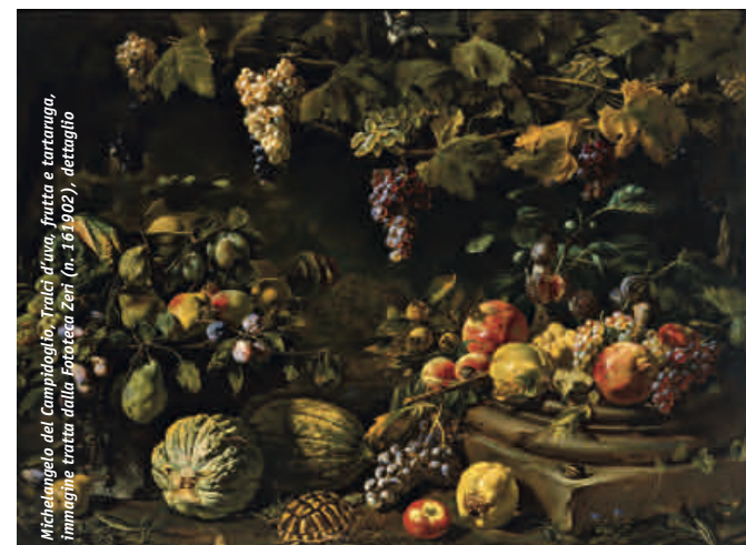
Michelangelo del Campioglio, "Tralci d'uva, frutta e tartaruga", immagine tratta dalla "Poesia Zen" (n. 16/1902), dettaglio